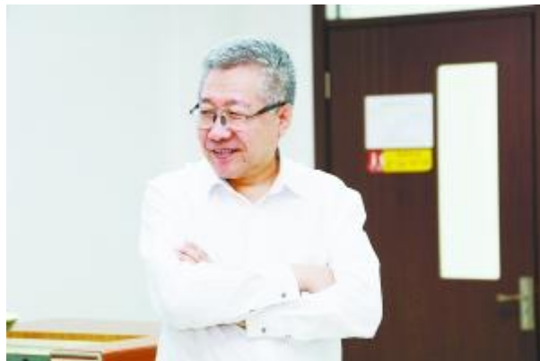
对话中国社科院世界社保研究中心主任郑秉文