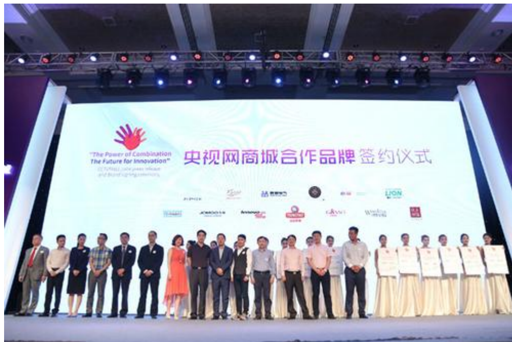
(图为参会领导及嘉宾合影)

2015 年 12 月，央视网商城优质商家遴选会在国家会议中心隆重举行，央视网商城相关领导、商界代表、电商行业专家学者、企业家及媒体等百余人莅临发布会，共同见证央视网商城 2015 全新商业模式——“联合发布”震撼亮相。