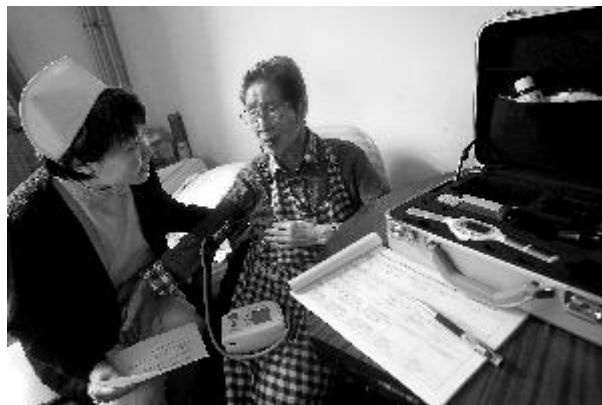
社区和医疗资源进行整合,为推广医养结合模式打下基础。(资料图)