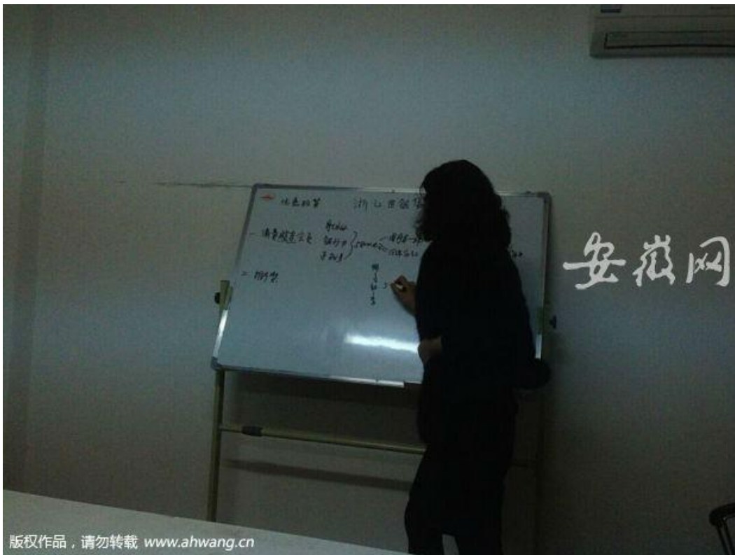
一名负责人在给老人上课。

听完女负责人的保证，新安晚报安徽网记者又问，一位老人只要投5800元，就能享受那么多分红。公司哪来那么多钱补贴分红？女负责人笑着回答：“我们公司现在在全球都有产业，我们的利润非常大，完全能够补贴会员的分红。”