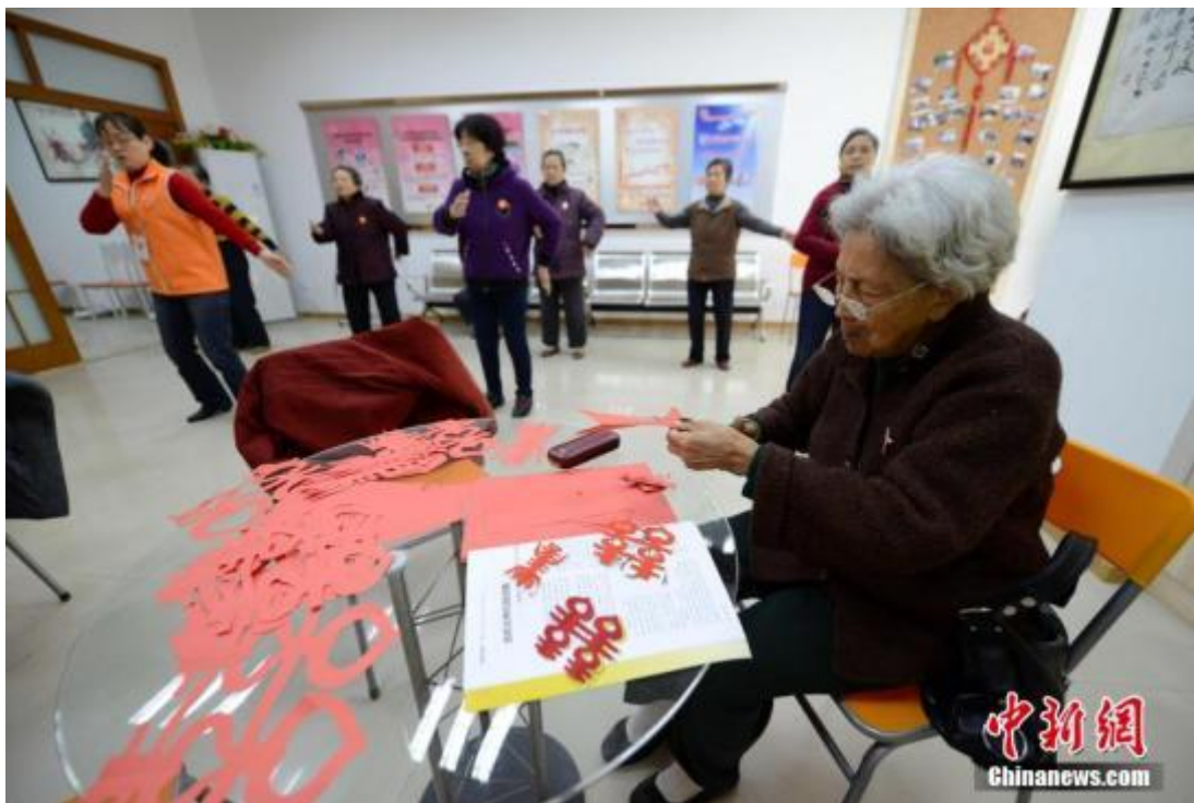
资料图 王东明 摄

据保监会网站消息，中国保监会近日召开老年人住房反向抵押养老保险试点工作座谈会，保监会副主席黄洪要求，2016年要在现有四个试点城市的基础上，选择经济条件较好、房地产市场较为规范、当地政府支持的城市和地区纳入试点范围，通过扩大业务经营区域，在发展中解决问题，使更多的老年人享受到这项政策福利。