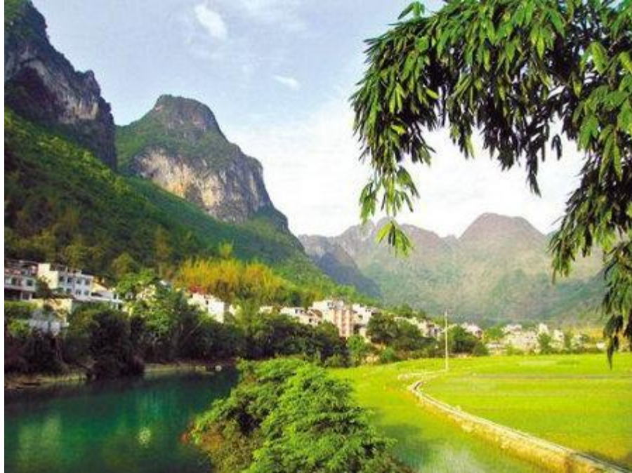
巴马长寿村盘阳河逶迤地流淌，串起了一个个小村落

巴马瑶族自治县位于广西壮族自治区西北部，是世界五大长寿之乡中百岁老人分布率最高的地区。