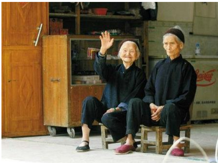
巴马长寿村里一对没有血缘关系的传奇百岁“姐妹”的家

巴马瑶族自治县位于广西壮族自治区西北部，是世界五大长寿之乡中百岁老人分布率最高的地区。