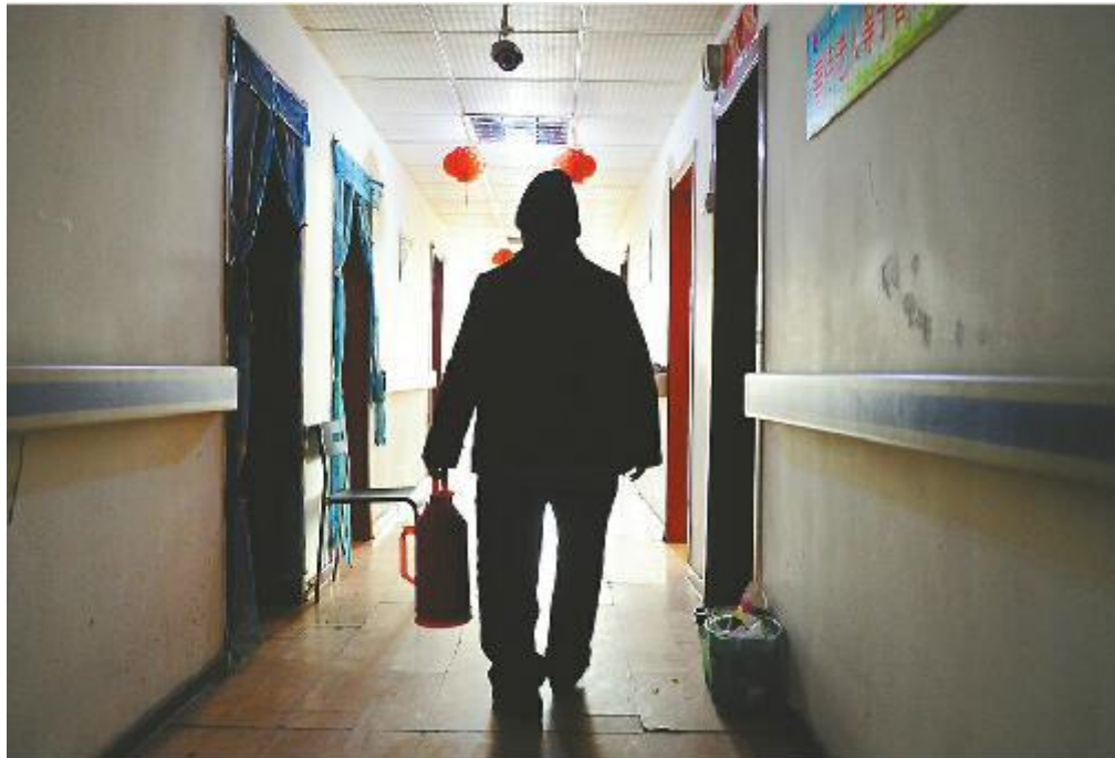
养老院里的一位老人，提着暖瓶去接水。