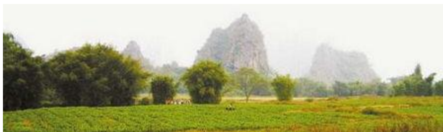
怀集世外桃源村秀美的自然风光是长寿养生的最主要原因

桃源村在肇庆怀集县桥头镇，自西晋六年建村至今已有 1700 多年历史。当地村民世代通过一段四