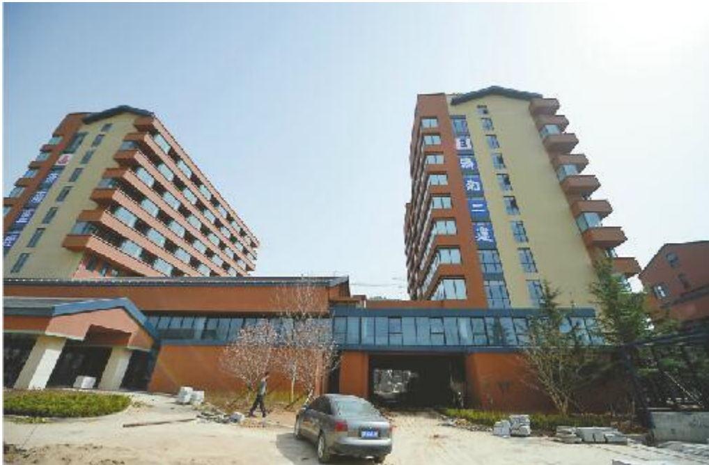
南部山区的一处医疗养老机构