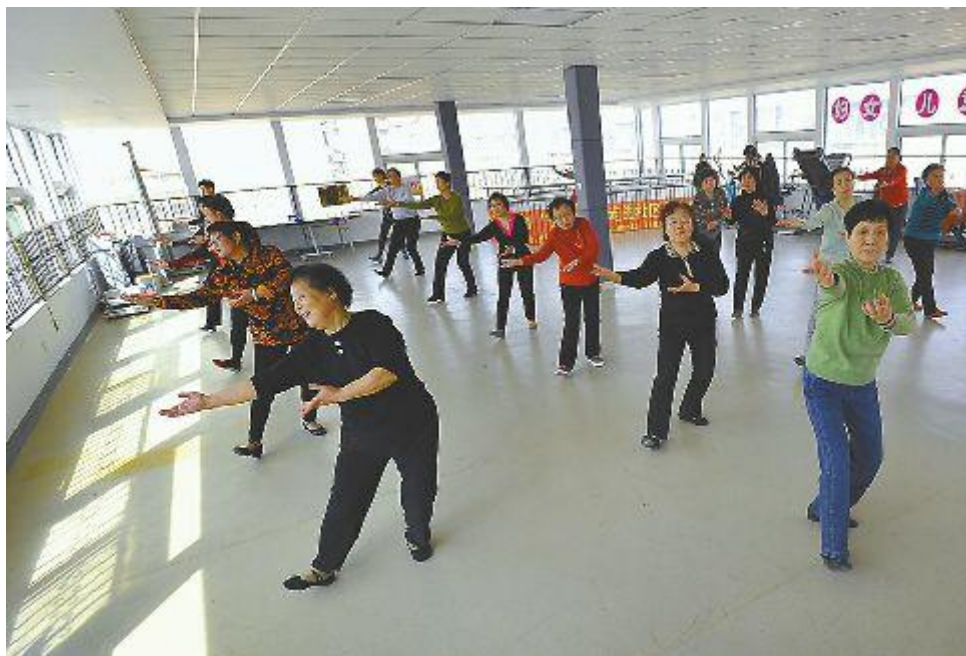
南辛庄街道北街社区幸福世家日间照料中心内，社区居民正在活动室活动。

2016年3月1日，山东省人民政府召开民政厅解读《山东省养老服务业转型升级实施方案》的研讨会。记者从会上了解到，截至2015年底，我省60岁以上老年人近1900万人，其中济南市60岁以上老年人口达到了123.17万，占全市总人口19.68%。目前，济南的养老格局为“9073”，即90%为居家养老、7%为社会养老、3%为机构养老。