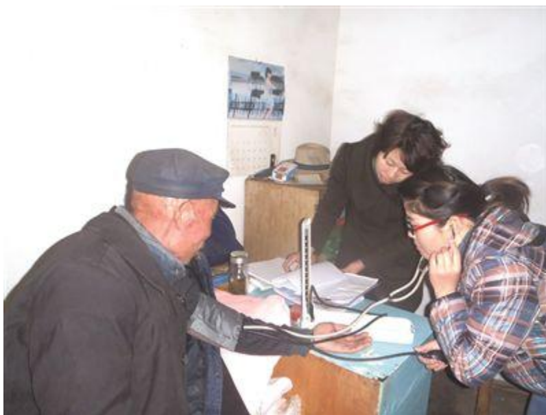
南京银杏树老年人服务中心浦口地区工作人员上门为老人提供量血压服务

养老院床位有限，老人住不进去。社区里的社工有限，鳏寡孤独老人照顾不过来。面对这样的供需矛盾，养老该如何“破题”？在新实施的《江苏省养老服务条例》中，记者注意到民政部门推进以社区为平台，积极构建机构养老和居家养老服务相结合的养老服务模式。这就意味着，今后在家养老，也能享受到养老机构提供的诸如打扫卫生、助医、助洗等服务。