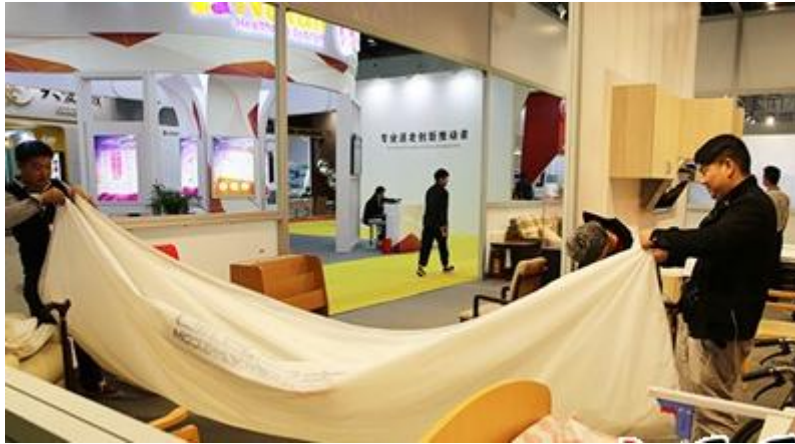
图为参展商开始撤展

【导读】第五届中国国际养老服务业博览会落下帷幕，经过多年的积累与沉淀，该博览会的规模、影响力，以及专业化、多元化程度都有所提升，为我国养老产业发展贡献力量。