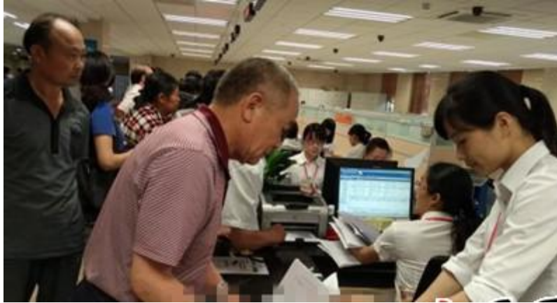
广东梅州灵活就业人员养老保险如何一次性缴费成咨询热点

“仅仅一上午，就有 100 多人来咨询、申办一次性缴费。”在梅县区行政服务中心，人社部门相关工作人员告诉记者，5月3日前来咨询、申办的群众特别多。“一次性缴费必须同时符合3个条件：一是本市户籍（不含男60周岁、女55周岁后取得我省户籍的），二是未领取企业职工基本养老金或城乡居民基本养老金，三是2006年7月1日（不含本日）之前男未满60周岁、女未满55周岁，且2016年5月1日（不含本日）前男满45周岁、女满40周岁的人员。符合以上条件人员，可根据年龄不同、未参保缴费时段的不同一次性缴纳1至118个月不等的养老保险费。”在梅州市社保局办事大厅，记者采访多名群众发现，他们大多是前来咨询了解情况的，工作人员则耐心地向他们解释。