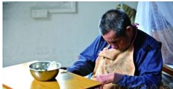
一位老人边吃午餐边打盹。

市政府出台《关于加快发展养老服务业的实施意见》2020年前居家呼叫服务和信息服务网络覆盖率100%——