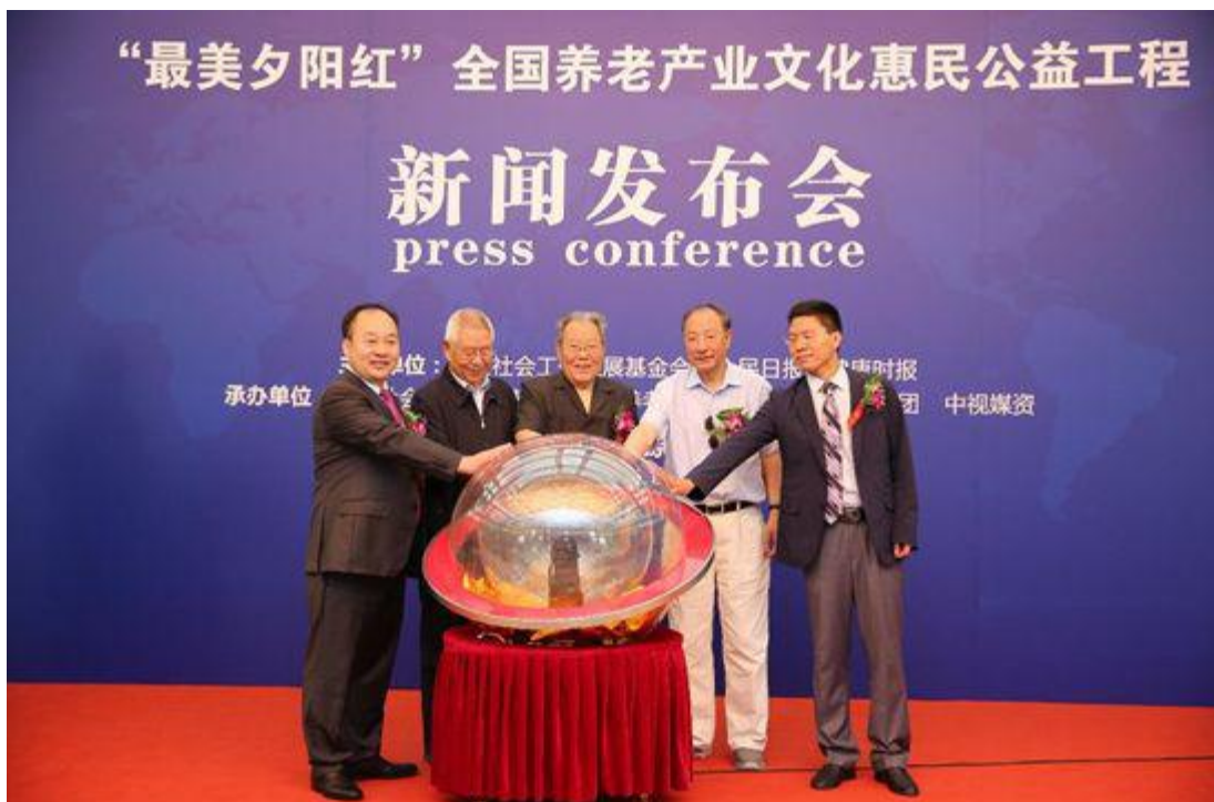
“最美夕阳红·全国养老产业文化惠民公益工程”活动启动仪式

2016年6月12日，由中社社会工作发展基金会、人民日报社健康时报，中社社会工作发展基金会社会养老产业发展基金、龙骏家园、中视媒资承办的“最美夕阳红·全国养老产业文化惠民公益工程”活动启动仪式暨新闻发布会在北京人民大会堂举行。