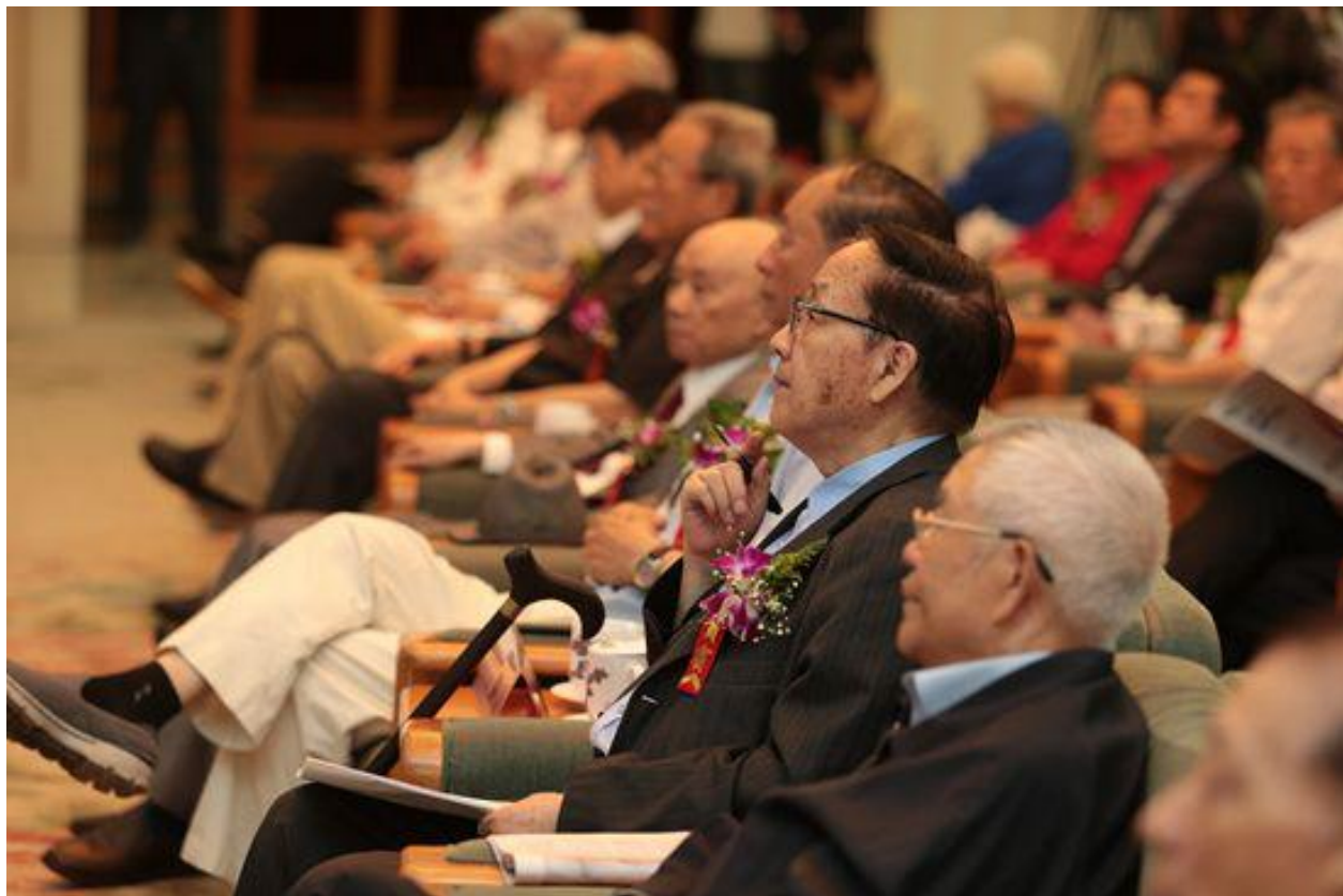
“最美夕阳红·全国养老产业文化惠民公益工程”

据悉，“最美夕阳红·全国养老产业文化惠民公益工程”包括“最美夕阳红”百城千场中老年才艺公益活动、发起成立“养老智库”、全国养老产业文化惠民工作座谈会、“最美夕阳红”大型人文纪录片、“最美夕阳红”微电影、“养老会客厅”新媒体项目、《百位老人的中国梦》图书文库、“最美夕阳红”摄影作品巡回展、“最美夕阳红”文化之旅、“最美夕阳红”文化养老媒体行等数十个项目，打造民营企业参与老年文化事业产业的样本工程。