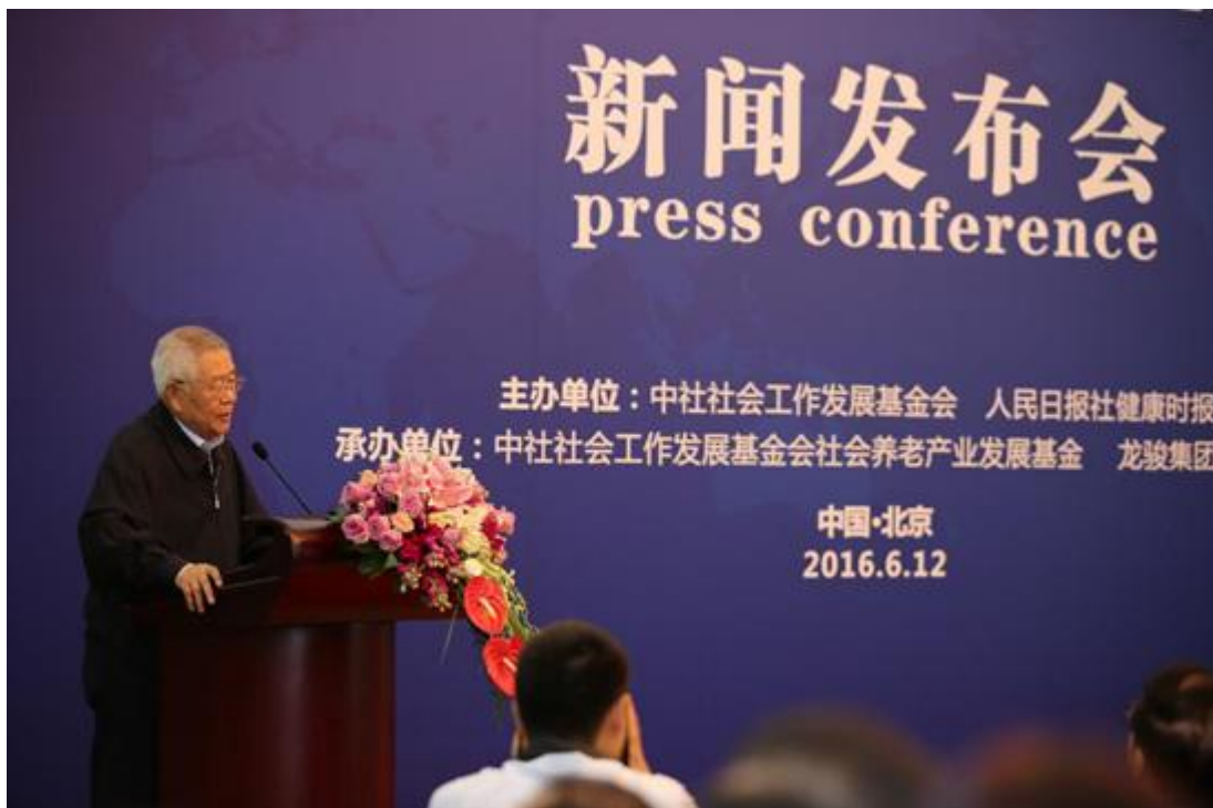
国务院新闻办公室原副主任杨正泉致辞

国务院新闻办公室原副主任杨正泉说，近年来，我国养老事业不断创新，取得了一定成效、积累了部分经验。要把养老和养生相结合，把物质养老和文化养老相结合，把满足老年人的基本生活需要与老年人有尊严地活着相结合。要帮助老年人由被动养老转变为老年文化建设的主力军和志愿者，为他们的自强不息创造条件、设立平台。