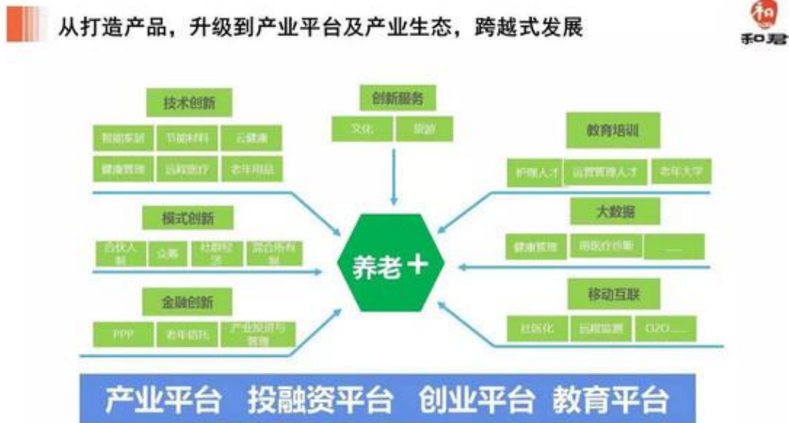
图：“养老+”平台模式图