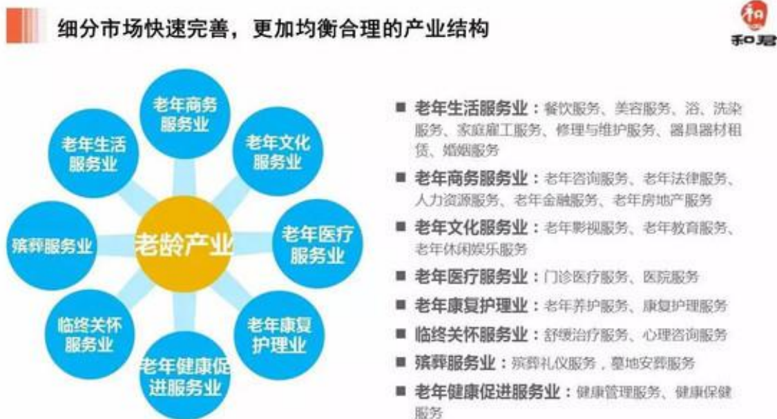
图：老龄产业构成图

其实老年需求是多元化、多层次的，从现有老龄产业的终端产品（产品、服务）看，不仅种类单一，甚至存在空白，不仅行业界限不清晰，行业上下游之间没有符合市场规律的构建。