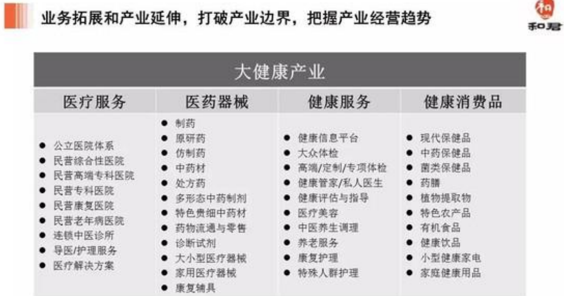
图：大健康产业版图

大政策扶持养老服务业加快发展。保险公司、医药医疗企业、中医养生、有机农业、生态旅游都看中了其间巨大的发展空间，纷纷加快了布局发展自身的养老板块业务。