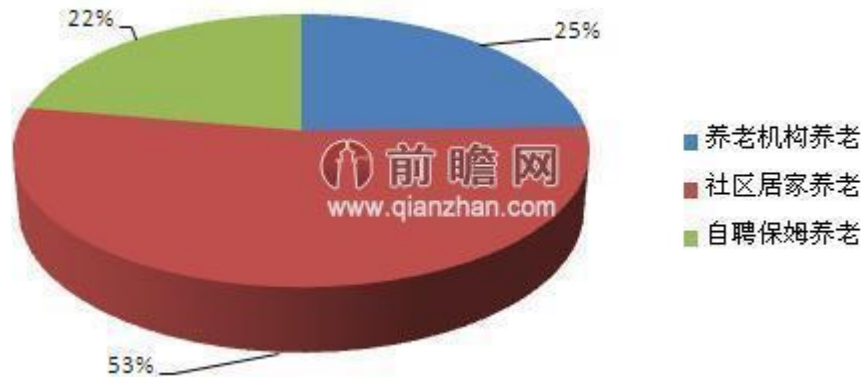
选择养老机构的比例(单位：%)

然而通过调查显示，希望将来入住养老机构的占参与调查总数的24.5%，远远高于目前的3%，养老公寓对于总量逼近2亿的中国老人来说，是一个非常大对市场。