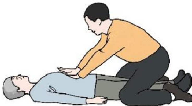
卧位的上腹部冲击法/胸部冲击法