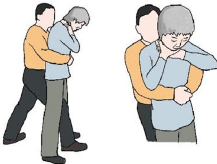
立位的上腹部冲击法/胸部冲击法