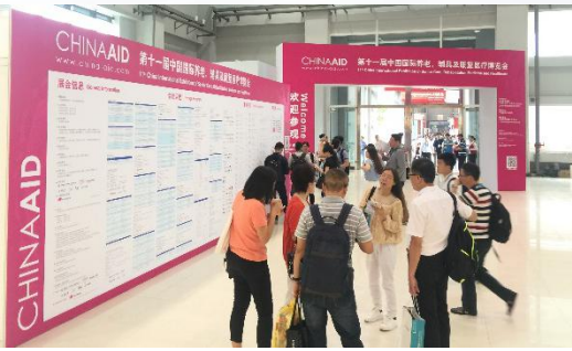
China Aid 开幕