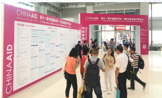
China Aid 开幕