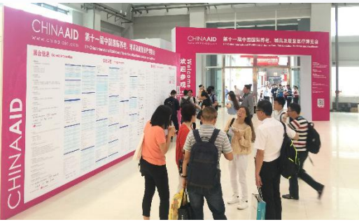
China Aid 开幕