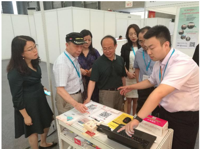
老龄办及民政部中民养老规划院领导 莅临中国养老网展台指导工作