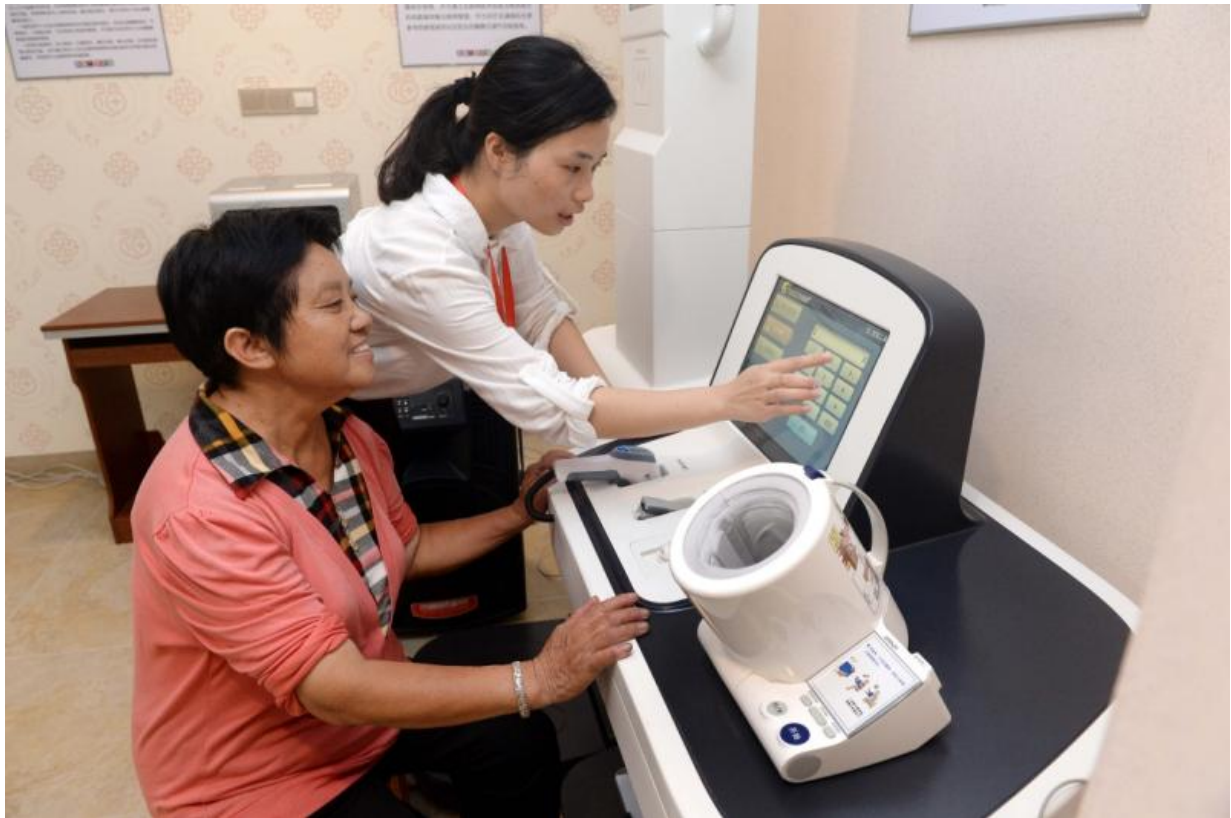
赣州市章贡区三康庙社区居家养老服务中心的老人在进行日常体检（6月24日摄）。

江西省赣州市章贡区人口老龄化问题突出，为进一步提升养老的专业化水平，章贡区自2016年起推行政府与社会资本合作的方式运营专业化社区居家养老服务中心，以居家为基础、社区为依托、机构为补充、医养结合，为老年人提供老年送餐、日间照料、全科医生签约等养老服务。目前，通过政企合作的方式，全区已有18个专业化的社区居家养老服务中心启用。