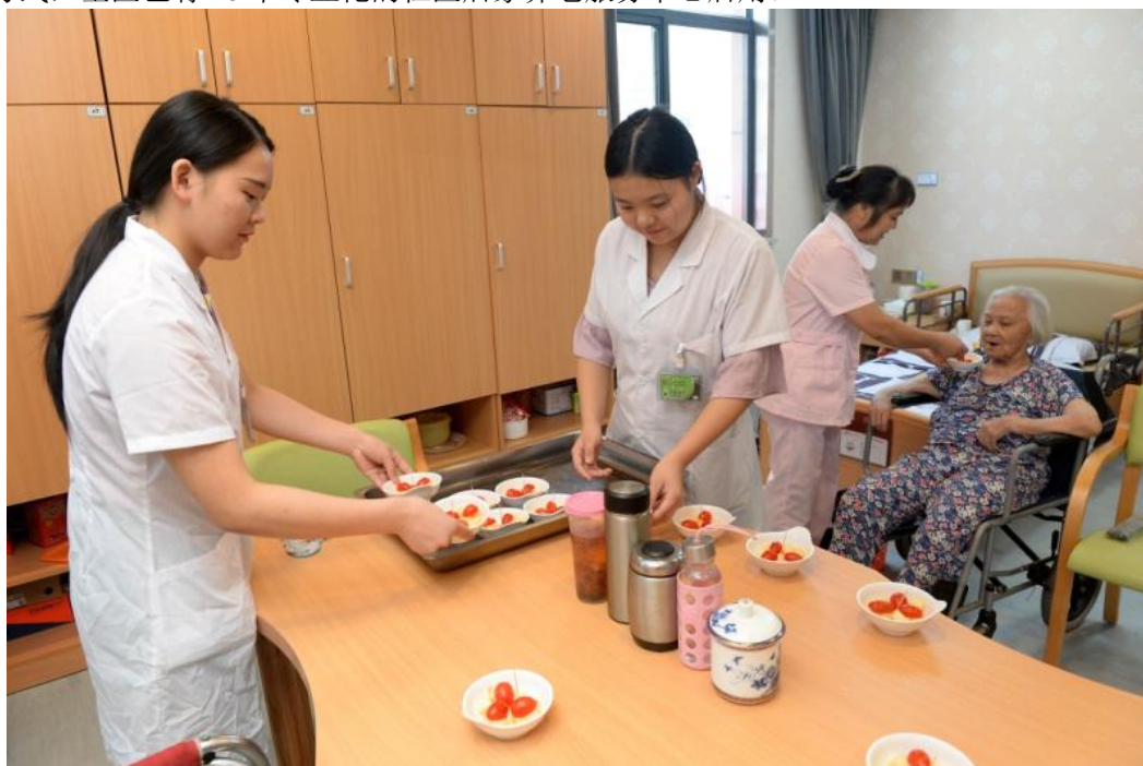
赣州市章贡区三康庙社区居家养老服务中心护理人员为老人们分发水果（6月24日摄）。

江西省赣州市章贡区人口老龄化问题突出，为进一步提升养老的专业化水平，章贡区自2016年起推行政府与社会资本合作的方式运营专业化社区居家养老服务中心，以居家为基础、社区为依托、机构为补充、医养结合，为老年人提供老年供餐、日间照料、全科医生签约等养老服务。目前，通过政企合作的方式，全区已有18个专业化的社区居家养老服务中心启用。