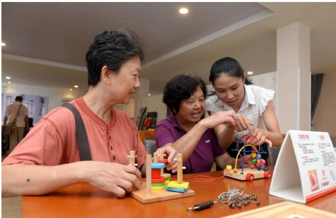
赣州市章贡区三康庙社区居家养老服务中心的老人们在休闲娱乐（6月24日摄）。

江西省赣州市章贡区人口老龄化问题突出，为进一步提升养老的专业化水平，章贡区自2016年起推行政府与社会资本合作的方式运营专业化社区居家养老服务中心，以居家为基础、社区为依托、机构为补充、医养结合，为老年人提供老年供餐、日间照料、全科医生签约等养老服务。目前，通过政企合作的方式，全区已有18个专业化的社区居家养老服务中心启用。