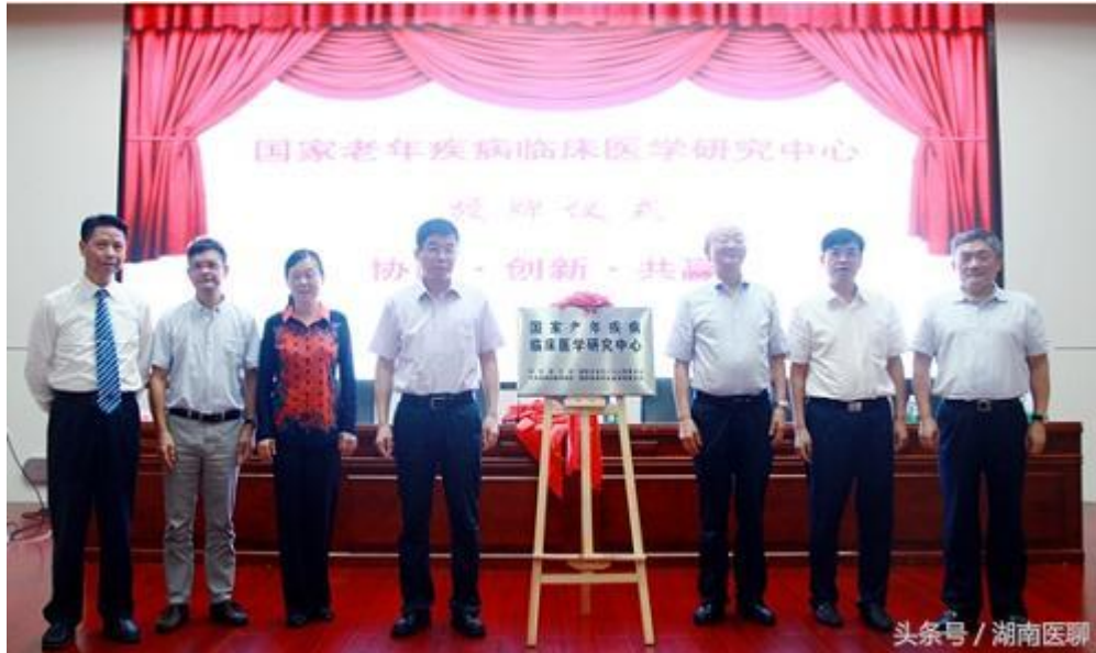
(首届中国老年医学临床与转化·潇湘高峰论坛开幕)

心成员单位、600余家网络成员单位、医研企成员单位授牌，旨在与核心成员单位协同创新，研发新技术、新方法、新理念，实现临床转化，在网络成员单位中则积极开展技术推广和培训。