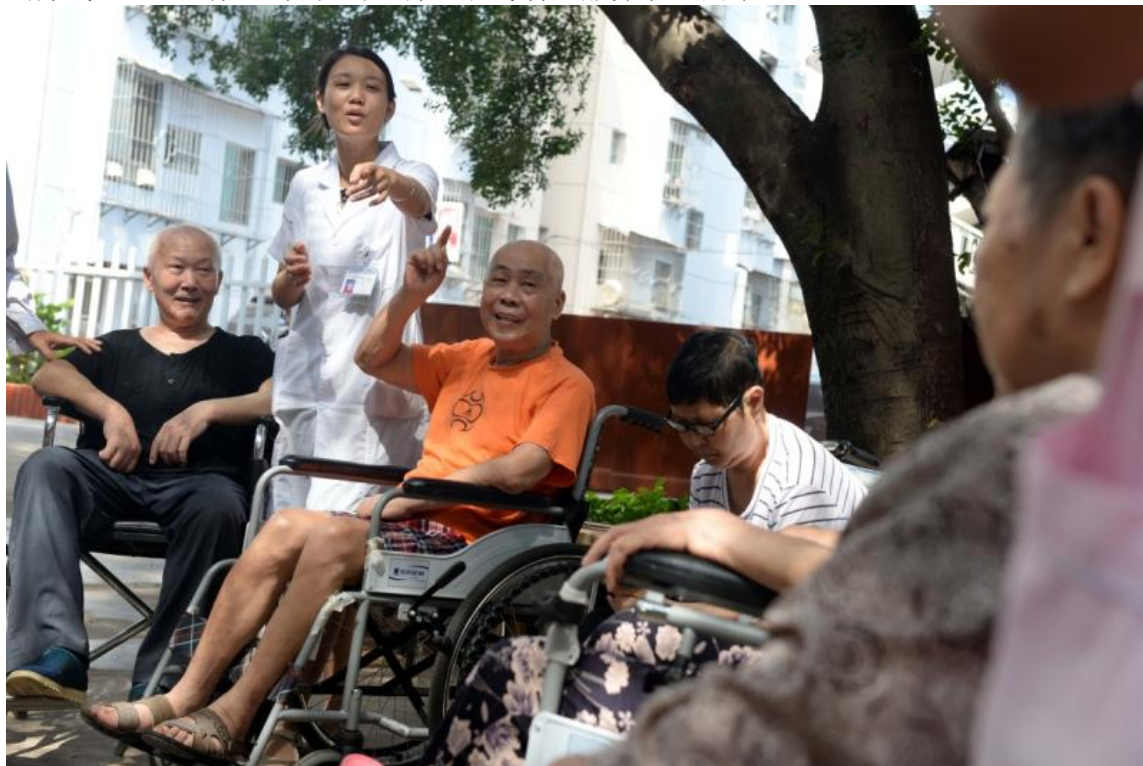
赣州市章贡区三康庙社区居家养老服务中心的老人在护理人员的陪伴下在院里休息聊天（6月24日摄）。

推行政府与社会资本合作的方式运营专业化社区居家养老服务中心，以居家为基础、社区为依托、机构为补充、医养结合，为老年人提供老年供餐、日间照料、全科医生签约等养老服务。目前，通过政企合作的方式，全区已有 18 个专业化的社区居家养老服务中心启用。