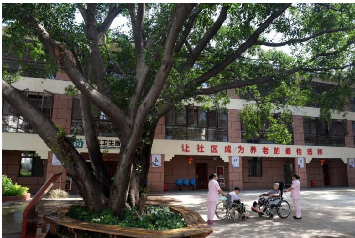
赣州市章贡区三康庙社区居家养老服务中心的老人在护理人员的陪伴下在院里休息聊天（6月24日摄）。

江西省赣州市章贡区人口老龄化问题突出，为进一步提升养老的专业化水平，章贡区自2016年起推行政府与社会资本合作的方式运营专业化社区居家养老服务中心，以居家为基础、社区为依托、机构为补充、医养结合，为老年人提供老年送餐、日间照料、全科医生签约等养老服务。目前，通过政企合作的方式，全区已有18个专业化的社区居家养老服务中心启用。