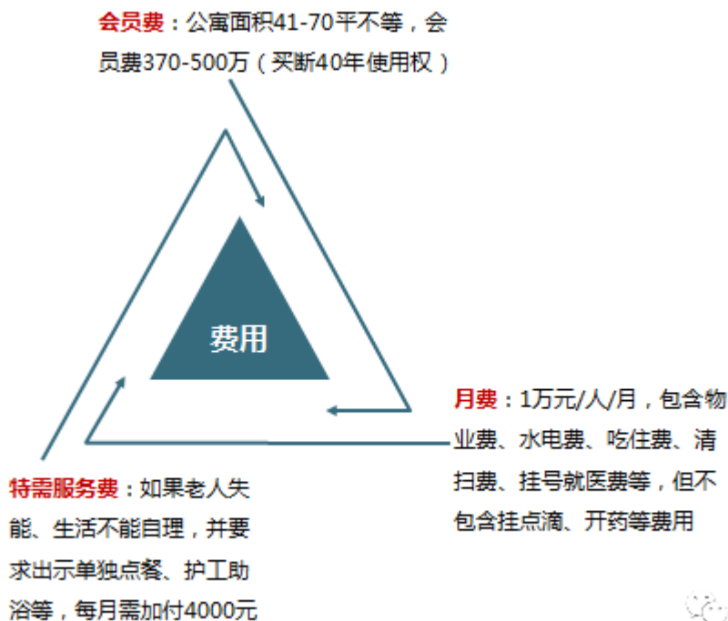
图：鸿泰·乐璟会费用构成

土地性质系医疗慈卫用地，鉴于土地性质问题，只能出售使用权。将来的运营成本高，主要依靠康复护理等服务盈利。其费用构成如下：