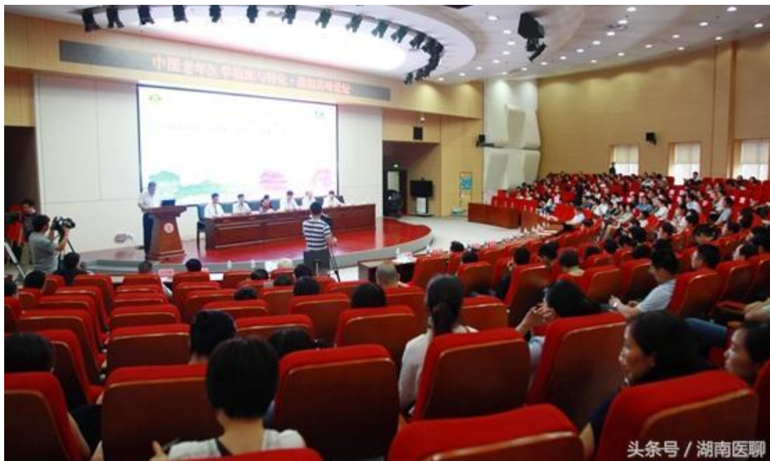
(首届中国老年医学临床与转化·潇湘高峰论坛开幕)