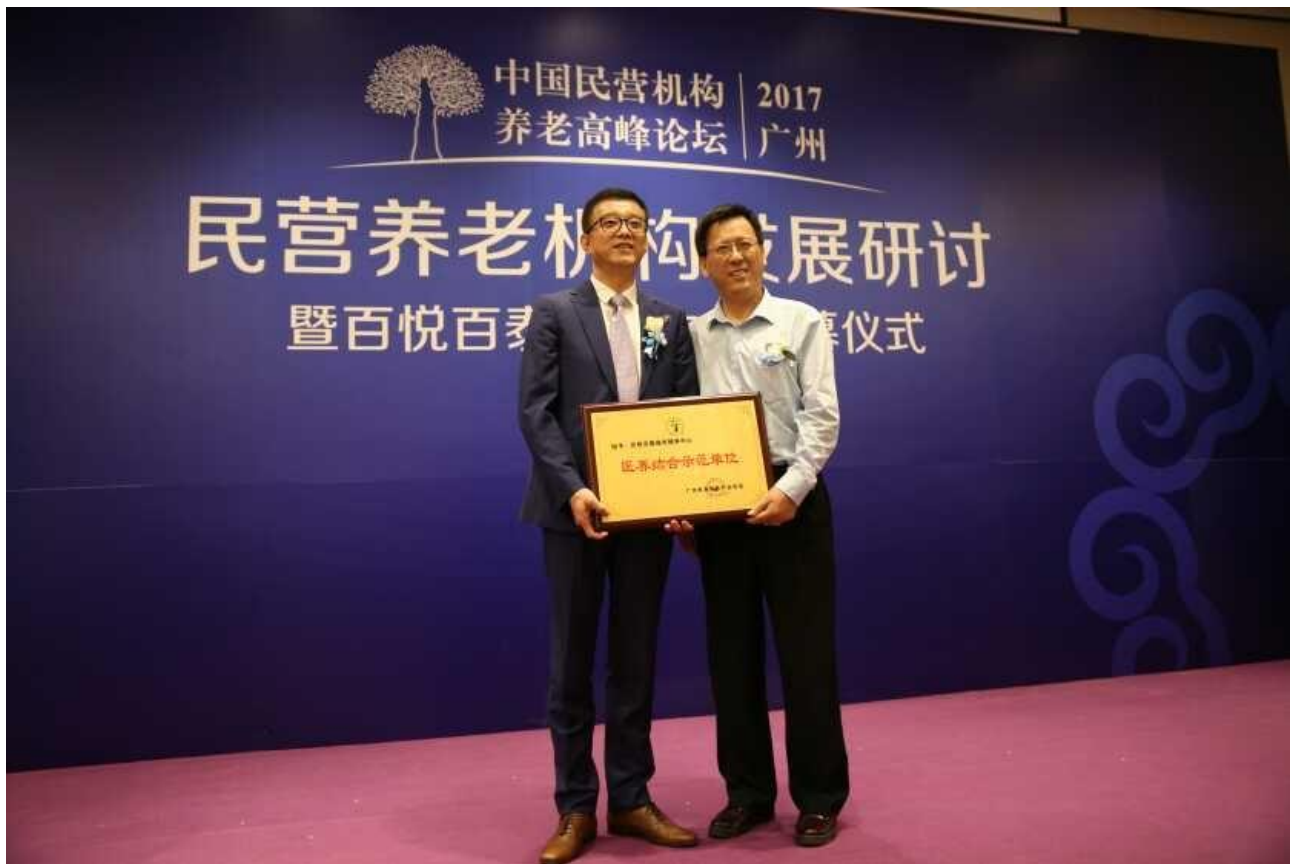
“广州医养结合示范基地”花落百悦百泰城市颐养中心