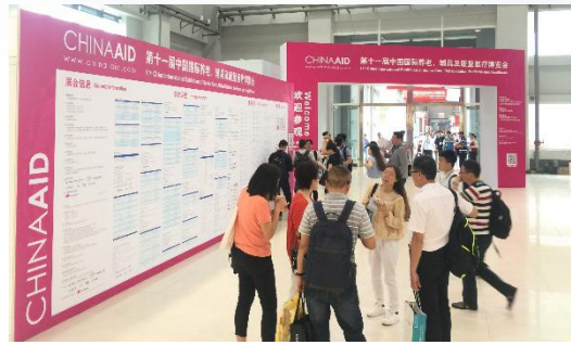
China Aid 开幕