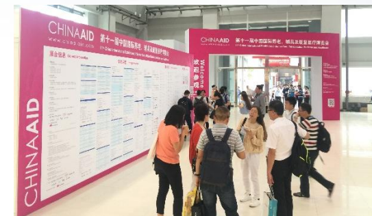
China Aid 开幕