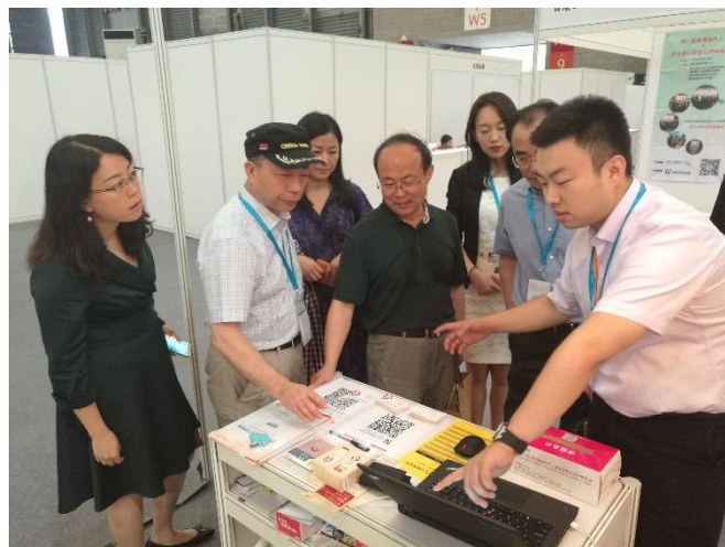
老龄办及民政部中民养老规划院领导 莅临中国养老网展台指导工作