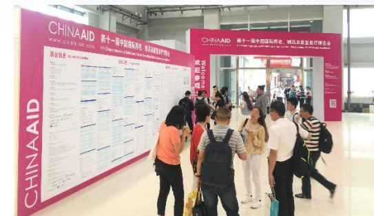
China Aid 开幕