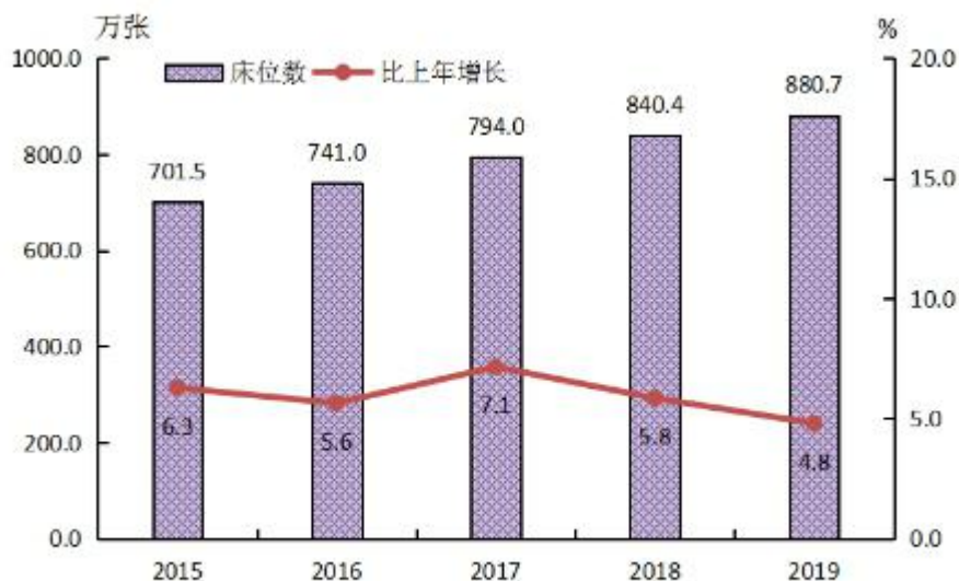
图2 全国医疗卫生机构床位数及增长速度

（二） 床位数 。2019年末，全国医疗卫生机构床位880.7万张，其中：医院686.7万张（占78.0%），基层医疗卫生机构163.1万张（占18.5%），专业公共卫生机构28.5万张（占3.2%）。医院中，公立医院床位占72.5%，民营医院床位占27.5%。与上年比较，床位增加40.3万张，其中：医院床位增加34.7万张（公立医院增加17.4万张，民营医院增加17.3万张），基层医疗卫生机构床位增加4.8万张，专业公共卫生机构床位增加1.1万张。每千人口医疗卫生机构床位数由2018年6.03张增加到2019年6.30张。