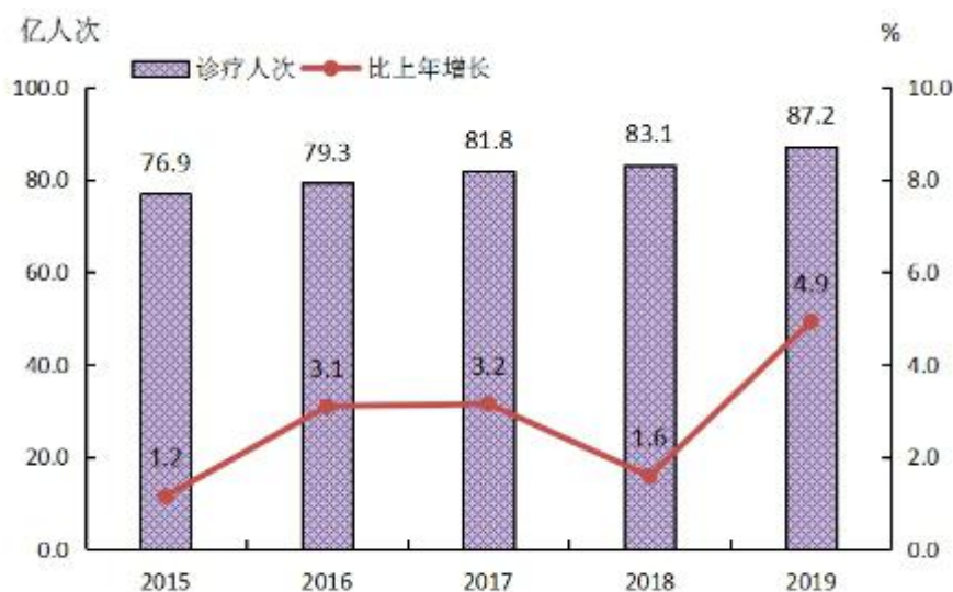
图4 全国医疗卫生机构门诊量及增长速度

2019年公立医院诊疗人次32.7亿人次（占医院总数的85.2%），民营医院5.7亿人次（占医院总数的14.8%）（见表5）。